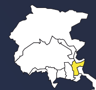
DOC FRIULI ISONZO