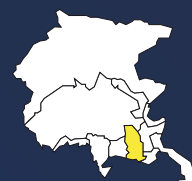
DOC FRIULI AQUILEIA