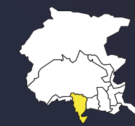
DOC FRIULI LATISANA