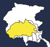
DOC FRIULI GRAVE