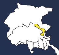
DOC COLLI ORIENTALI DEL FRIULI