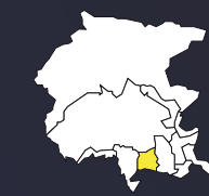
DOC FRIULI ANNIA

ersa Agenzia regionale per lo sviluppo rurale